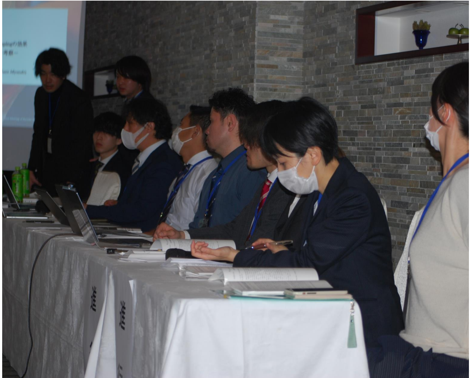
聖マリア病院を主とした運営陣